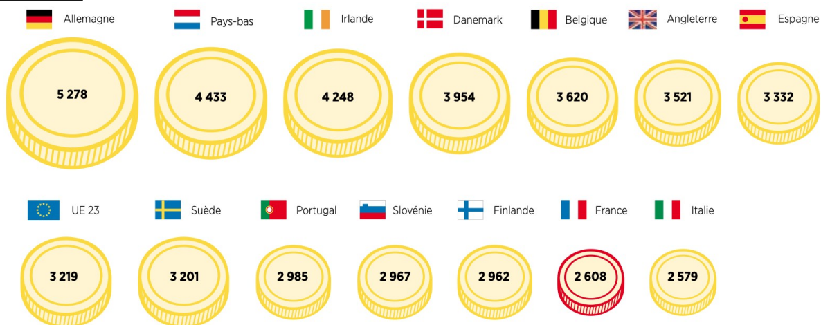
Graphique 1 : Salaire mensuel moyen* au bout de 15 ans de carrière et en parité de pouvoir d'achat**